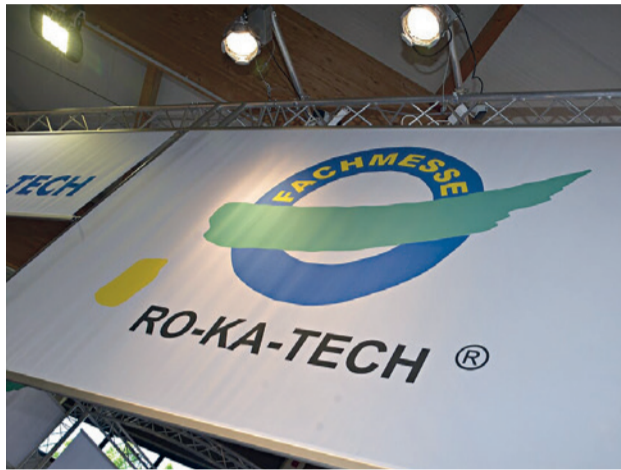
Unter dem Titel „Sanierung 2020–2030 – Quo vadis?“ bot die Ro-Ka-Tech 2019 in Kassel ein Vortragsprogramm zu grabenlosen Technologien an.

311 Aussteller haben auf der internationalen Fachmesse für Rohr- und Kanaltechnik Ro-Ka-Tech vom 8. bis 10. Mai 2019 auf 30.000 Quadratmetern innovative Produktlösungen rund um die unterirdische Infrastruktur präsentiert. Ganz neu im diesjährigen Messegesehen: Unter dem Titel „Sanierung 2020–2030 – Quo vadis?“ hat der Messe-Organisator VDRK, Verband der Rohr- und Kanaltechnik, ein Vortragsprogramm zu grabenlosen Technologien in den Kontext der Fachausstellung eingebettet. Die vom rbv, der GSTT, dem RSV und dem VSB gemeinsam konzeptuierten Tagungsblöcke erwiesen sich in ihrer ersten Ro-Ka-Tech-Auflage als sehr gute inhaltliche Ergänzung des erfolgreichen langjährigen Messekonzepts.