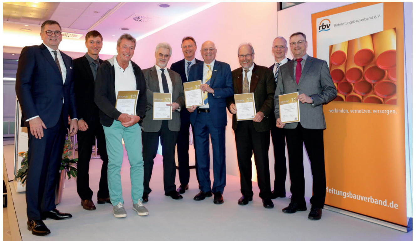
Auf eine 10-jährige Mitgliedschaft als ordentliche Mitglieder können die Huber Rohrleitungsbau GmbH aus Halfing und die SGL Spezial- und Bergbau-Servicegesellschaft Lauchhammer mbH aus Lauchhammer zurückblicken. Für eine 10-jährige Fördermitgliedschaft wurden die GSTT – German Society for Trenchless Technology e. V., Berlin und der AGFW – Der Energieeffizienzverband für Wärme, Kälte und KWK e. V., Frankfurt am Main sowie die Gütegemeinschaft Leitungstiefbau e. V., Berlin geehrt.

Mit einem Augenzwinkern verabschiedete rbv-Präsident Lang die anwesenden Teilnehmer und wies darauf hin, dass der Leitungsbau noch nie so wertvoll wie heute gewesen sei. „Planen Sie Ihre Kapazitäten mit Augenmaß! Führen Sie mit ruhiger Hand. Wir lassen uns nicht treiben, von niemandem, auch nicht von der Politik“, so Lang in seinem Schlusswort. (rbv)