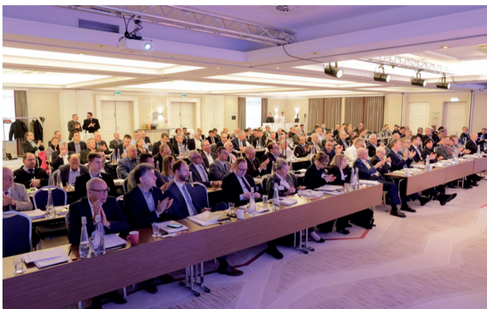
Die Mitgliederversammlung des Rohrleitungsbauverbandes e. V. fand in diesem Jahr am 5. April 2019 in München statt.

Mit dem Glasfaserausbau, dem Fachkräftemangel, der Verstetigung von Investitionen und der damit einhergehenden Schaffung von Planungssicherheit für Unternehmen sowie der notwendigen Sensibilisierung von Politik und Öffentlichkeit für technische Verfahren und Ausbaugeschwindigkeiten standen viele der entscheidenden Bullet Points des Leitungsbaus auf der Agenda der Mitgliederversammlung des Rohrleitungsbauverbandes e. V. (rbv). Dabei wurde klar, dass der rbv die gesamte Klaviatur einer starken Interessenvertretung des Leitungsbaus in aller erforderlichen Intensität und Lautstärke beherrscht, um heute und in Zukunft seiner Aufgabe nachzukommen, zu verbinden, zu vernetzen und zu versorgen.