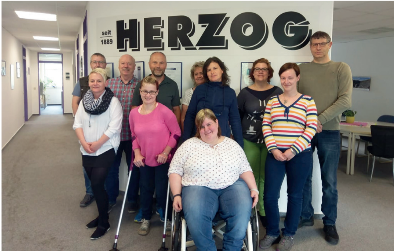
Bei der Herzog-Bau GmbH stehen alle Mitarbeiter im Büro zusammen. Die Einstellung von Menschen mit körperlichen Einschränkungen hat dazu geführt, den Horizont eines menschlichen Umgangs miteinander zu erweitern und ein besseres Verständnis aller Kolleginnen und Kollegen füreinander zu schaffen.

Armin Jordan: Hoffentlich ist das so. Gern sind wir auch Vorreiter und stellen uns allen Fragen für eine gemeinschaftliche Wahrnehmung der vielfältigen Farben und der Ernsthaftigkeit und Verantwortung den Menschen gegenüber, die nicht das Glück hatten, keine Einschränkung durch eine Behinderung zu haben. (rbv)