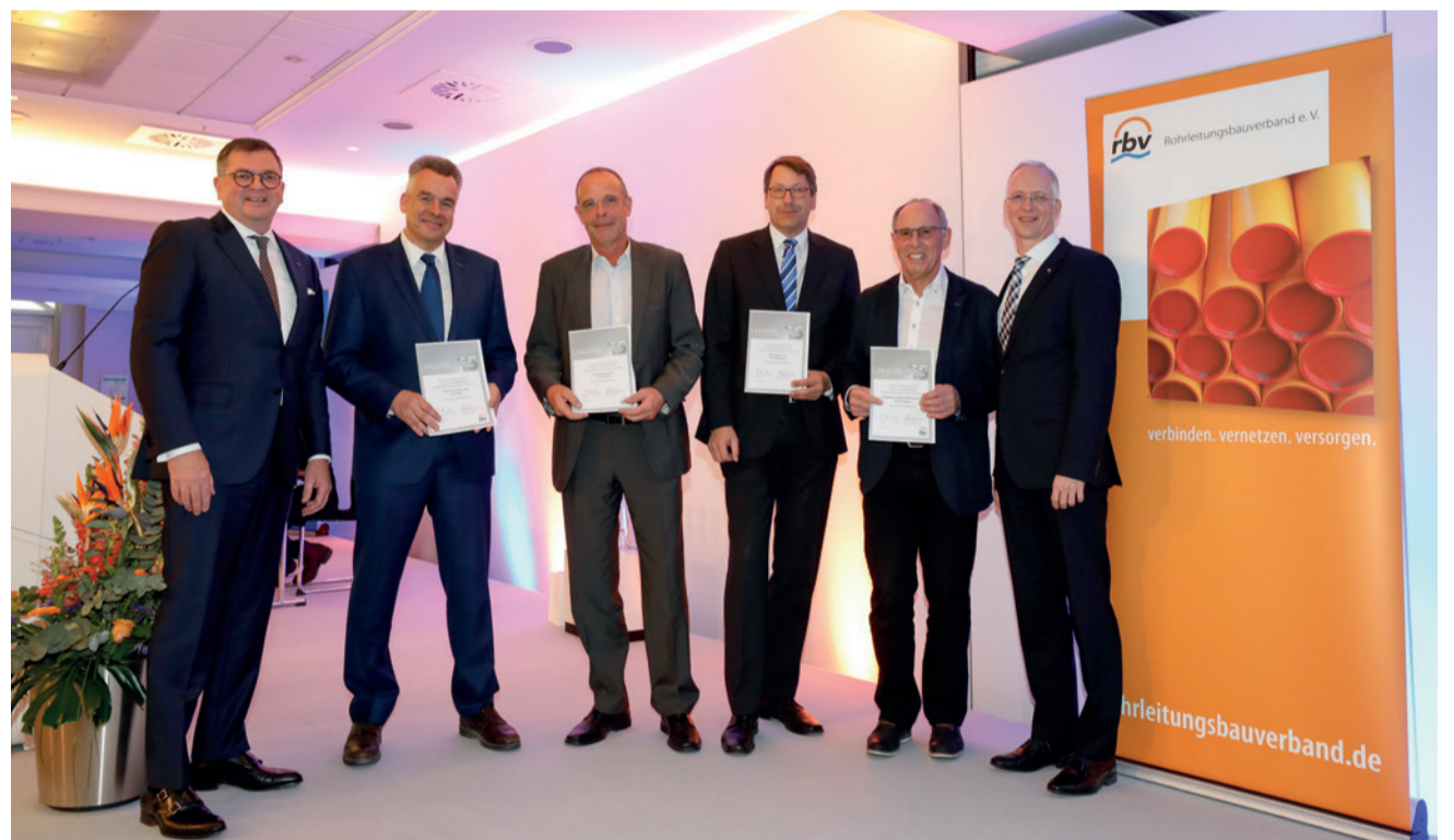
Ein Vierteljahrhundert gehören die Frisch & Faust Tiefbau GmbH aus Berlin, die Martin Bohsung GmbH aus Rutesheim, die MRA GmbH & Co. KG aus Mühlenbeck und die Strüder Rohr-, Regel- und Meßanlagen GmbH aus Schneeberg dem rbv bereits an.