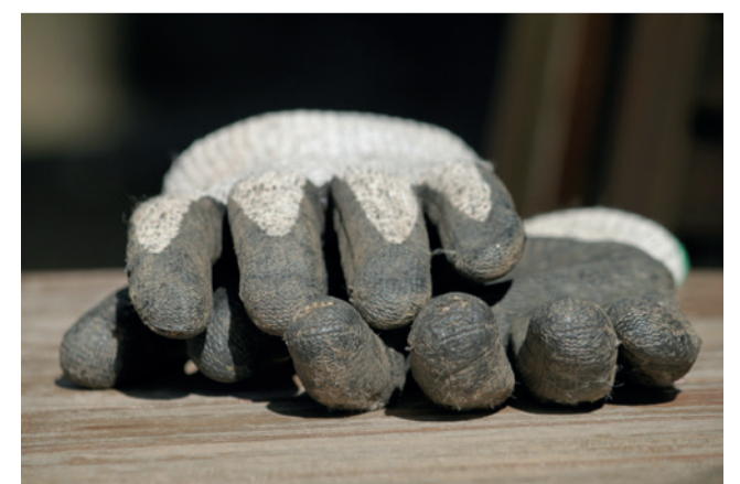
Ein Arbeiter, der ständig mit Werkzeugen oder Maschinen hantiert, benötigt geeignete Schutzhandschuhe, die die Anforderungen der Norm EN 388 erfüllen.

Hergestellt werden die Schutzhandschuhe aus Materialien wie Leder, Baumwolle und synthetischen Stoffen, beispielsweise Polyurethan, Polyester, Lycra und Nylon. Eine hohe Rutschfestigkeit wird durch die Beschichtung mit Latex erreicht. Arbeitshandschuhe aus Leder sind sehr robust, widerstandsfähig und strapazierfähig und eignen sich für den Einsatz als Montagehandschuhe im Bauhandwerk. Arbeitshandschuhe aus Synthetik sind dagegen elastisch, strapazierfähig und anpassungsfähig. Dabei wird Nylon besonders bei Montage-Arbeitshandschuhen verwendet und bietet einen optimalen Rundumschutz der Hände. Ähnlich sieht es bei Handschuhen aus dem Kunstharz Polyurethan aus. Sie passen sich besonders gut der Handform an und garantieren eine hohe Fingerbeweglichkeit. (haustechnikdialog)