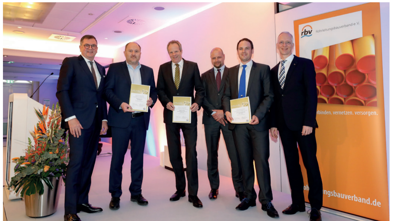
Für ihre 50-jährige Zugehörigkeit zum rbv wurden die Bohlen & Doyen GmbH aus Wiesmoor sowie die Diringer & Scheidel Bauunternehmung GmbH & Co. KG aus Mannheim sowie die Karl Krumpholz Rohrbau GmbH aus Kronach ausgezeichnet.