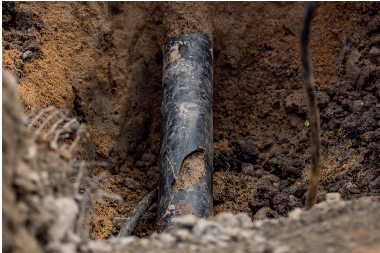
Was müssen Leitungsbauunternehmen über sogenannte Qualitätselement-Schäden wissen? Das aktuell vorliegende Informationspapier bringt die wichtigsten Aspekte auf den Punkt.

In letzter Zeit häufen sich bei Leitungsbauunternehmen die Forderungen nach Begleichung von sogenannten „Qualitätselement-Schäden“, die durch Versorgungsunterbrechungen, zum Beispiel durch Kabelriss, entstehen. Was steckt hinter dieser Entwicklung? Der Hauptverband der Deutschen Bauindustrie e. V. (HDB), der Bauindustrieverband Nordrhein-Westfalen e. V. und der Rohrleitungsbauverband e. V. (rbv) haben die wichtigsten dieser Entwicklung zugrunde liegenden Informationen zusammengestellt.