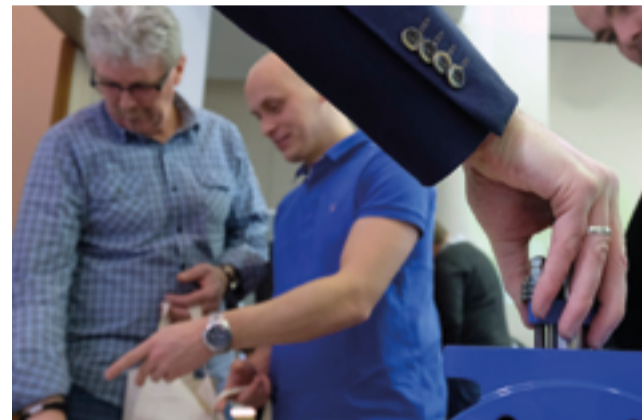
Die Teilnehmer nutzten die Gelegenheit, sich aus erster Hand über die ausgestellten Produkte und Verfahren zu informieren.

Inn Hotel in Köln, an seiner Kapazitätsgrenze. Schon jetzt kann der rbv für 2019 wieder mit einer ausgebuchten Veranstaltung rechnen. Dann werden die „3. Kölner Netzmeistertage“ am 27. und 28. März wieder in Köln stattfinden. (rbv)