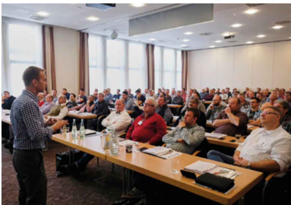
160 Rohrnetzmeister und Netzmeister von Leitungsbau- und Versorgungsunternehmen verfolgten auf den „2. Kölner Netzmeistertagen“ die Vorträge der Fachreferenten und Industrievorteiler.

Die „2. Kölner Netzmeistertage“ konnten an den Erfolg aus dem Vorjahr nahtlos anknüpfen. Hervorgegangen aus dem „Netzmeister Erfahrungsaustausch“, wurde das Veranstaltungskonzept 2017 von der rbv GmbH als Veranstaltungsdienstleister des Rohrleitungsbauverbandes e. V. komplett geändert. Seitdem präsentiert sich die gemeinsame Fachveranstaltung für die Bereiche Gas, Wasser und Fernwärme als eine gelungene Mischung aus Fachreferaten und Industrievorträgen mit einer begleitenden Ausstellung, in deren Rahmen rund 20 Hersteller produktspezifische Anwendungen demonstrieren. Das neue Konzept hat sich bewährt; das bestätigten sowohl teilnehmende Rohrnetzmeister und Netzmeister von Leitungsbau- und Versorgungsunternehmen als auch Referenten und Aussteller.