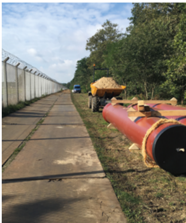
Mit Stahlplatten ausgelegte Baustellenstraße entlang des Zauns am Flughafen.

Für die Erneuerung der Leitungsbereiche aus Asbestzement fiel die Wahl auf duktile Gussrohre mit Tonerde-Zementmörtel-Auskleidung, die mit einer Baulänge von 6,00 m zum einen gut zu handhaben sind und zum anderen durch eine Steckmuffen-Verbindung ohne Schweißarbeiten längskraftschlüssig miteinander verbunden werden. Nach Zusammenschieben zweier Gussrohre wurden gusseiserne Verriegelungssegmente durch eine Öffnung in der Muffe im Rohrscheitel in die Schubsicherungskammer der Muffe eingeschoben, über den gesamten Rohrumfang verteilt und zusätzlich mit einem außenliegenden Spannband in ihrer Lage gesichert. Innerhalb der Rohrverbindung stützen sich die gusseisernen Elemente gegen eine umlaufende Schweißraupe am Rohrspitzenende ab. Durch die gerundete Gestaltung der Schubsicherungskammer ist bei voller Druckbelastung in jeder Verbindung eine Abwinkelung der Rohre von bis zu 1,5 Grad möglich.