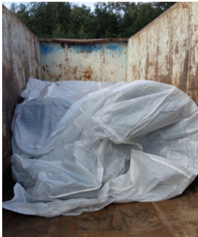
In Big-Packs verpackte Asbestzementrohre vor Abtransport zur Entsorgung.

Doch trotz all dieser Widrigkeiten wurde die geplante Bauzeit von Anfang August 2017 bis Ende Januar 2018 um rund sechs Wochen unterschritten – und das, obwohl die tatsächliche Bauzeit erst mit knapp drei Wochen Verspätung starten konnte. Das lag nicht zuletzt an der guten Koordinierung aller Beteiligten sowie an dem lösungsorientierten Umgang mit allen aufkommenden Problemen. „Der Bauherr war sehr zufrieden mit der Qualität und Termintreue“, so Porath. „Auch die Kommunikation und die Zusammenarbeit mit den Behörden, dem Forstbetrieb, der ökologischen Baubegleitung, der Berliner Wasserbetriebe und dem Flughafen funktionierten sehr gut.“ (MRA)