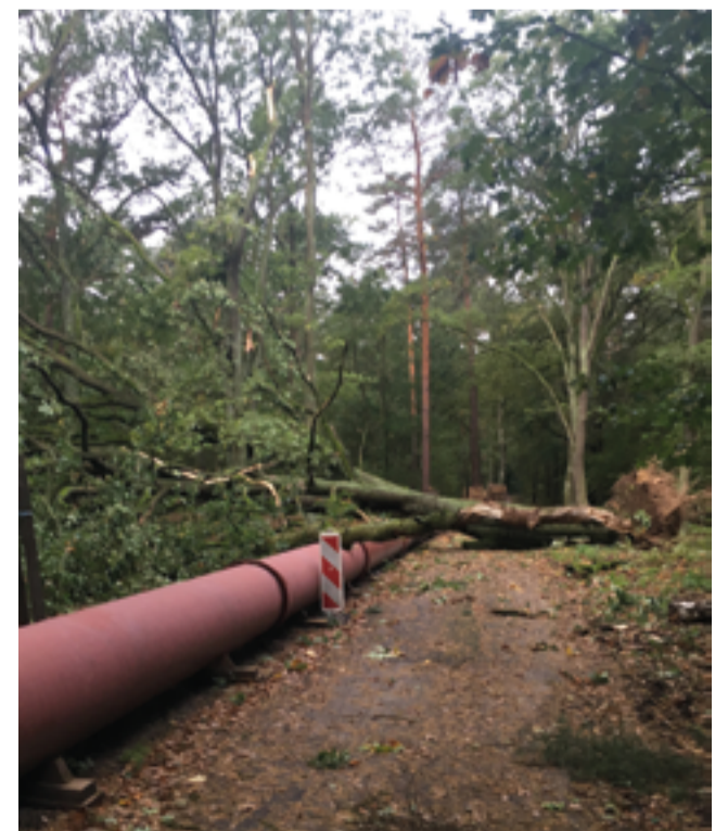
Sturm und anhaltende Regenfälle erschwerten nicht nur die Arbeiten bei der Sanierungsmaßnahme, sondern gefährdeten auch die oberirdisch verlegte Bypassleitung.