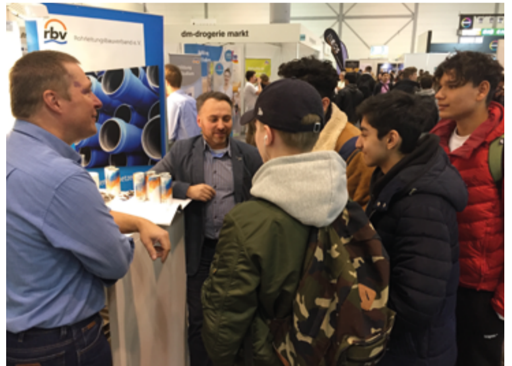
Als erfolgversprechend erwies sich die frühe Ansprache von jungen Menschen, die sich in der Entscheidungsphase ihrer Berufswahl befinden.