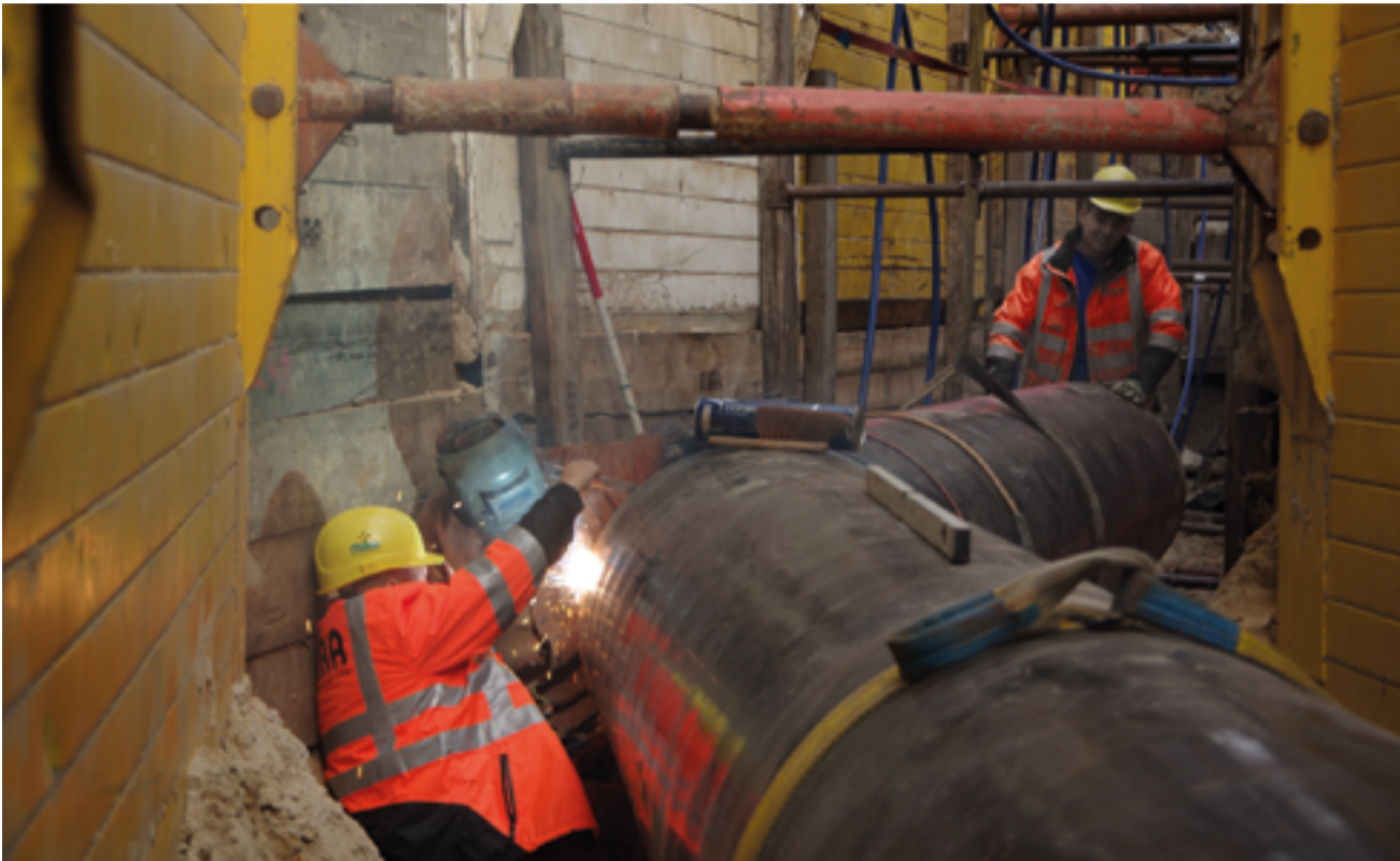
Verschweißen der Stahlrohre innerhalb des Rohrgrabens bei einer Abwinkelung in der Leitungstrasse.