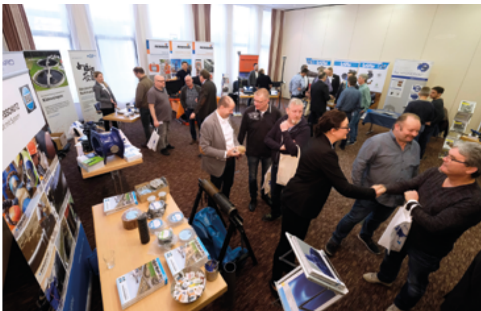
Unmittelbar angrenzend an die Vortragsräume fand die begleitende Fachausstellung statt.

richten uns bei der Themenauswahl daher konsequent nach den Bedürfnissen und dem Informationsbedarf der Netzmeister.“