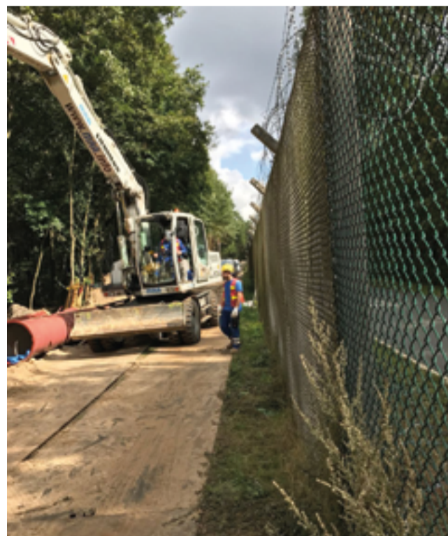
Der Zaun auf der einen Seite der Baustelle und der Wald auf der anderen verlangten den Maschinenführern einiges an Fingerspitzengefühl beim Rangieren ab.